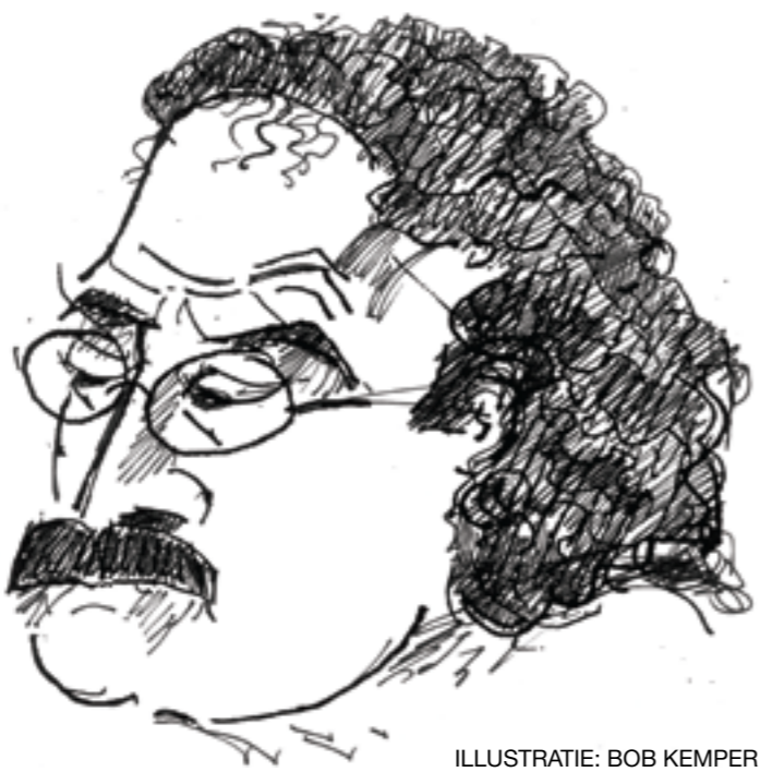
ILLUSTRATIE: BOB KEMPER

Welke fractie was de afgelopen jaren het meest